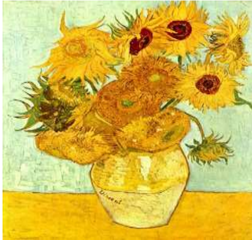
Doze girassóis numa jarra, de Van Gogh