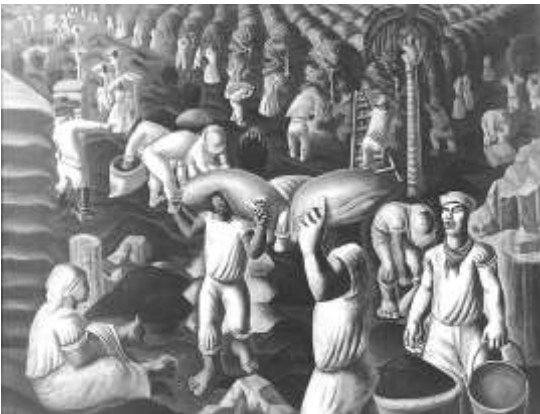
Café – 1935

5. 5. As Imagens abaixo são de dois famosos quadros de Cândido Portinari. O quinto parágrafo do texto refere-se a qual quadro do pintor? Marque.