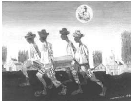
Enterro - 1959